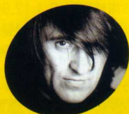
ユーリー・バシュメット (指揮/ヴィオラ) ロシア Yuri Bashmet conductor, viola / RUSSIA