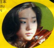
キム・スーヤン (ヴァイオリン) 韓国 Suyoen Kim violin / KOREA

● チケット先行販売 = 2011年1月15日(土)・16日(日)2日間の受付 ● チケット一般発売 = 2011年2月19日(土)午前10時より開始 ◆ 最新情報は財団ホームページでご覧いただけます。 http://www.argerich-mf.jp *詳しくは裏面をご覧ください。