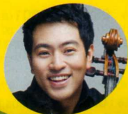
ユンソン (チェロ) 韓国 YoungSong cello / KOREA